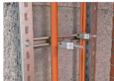
Монтаж кабеля с зажимными скобами, также возможен при последующей прокладке