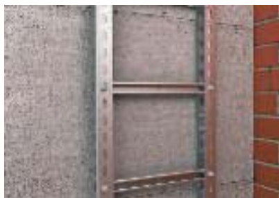
Настенный монтаж вертикальной трассы к монолитной стене