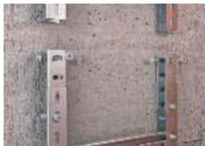
Стык с соединителем