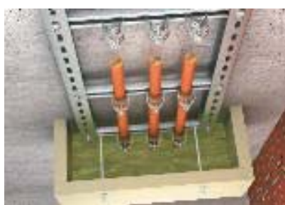
Эффективное средство для разгрузки кабеля от натяжения ZSE90

Вертикальные кабельные лотки лестничного типа, тип SLM отвечают всем требованиям DIN 4102 часть 12 как стандартные кабеленесущие конструкции.