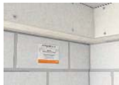
Маркировка в соответствии с правилами VDE