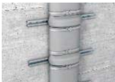
Крепление бандажа металлическими монтажными лентами при монтаже профильных реек