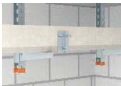
Надежное стыковое соединение в результате крепления предварительно смонтированной обшивки