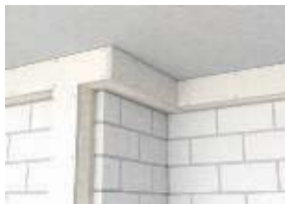
Гибкое расположение короба обеспечивается индивидуальными фасонными деталями