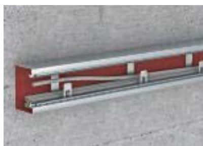
Скобы в качестве помощи при прокладке кабеля, предотвращающие выпадение кабеля