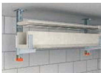
Свободно лежащая крышка для быстрой проверки и дополнительной прокладки