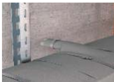
Кабельный вывод с бандажированием