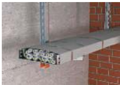
Полная обмотка подвесной кабельной трассы