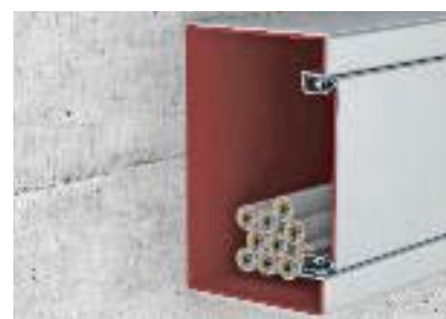
Монтаж крышки без винтов с помощью ввода в паз