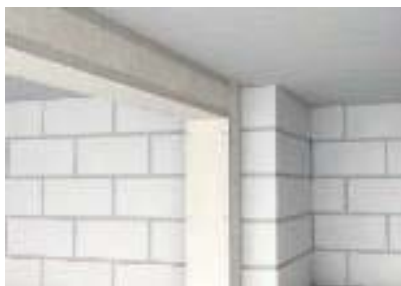
Прямой настенный и потолочный монтаж