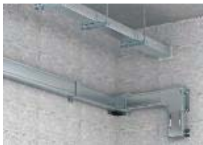
Настенный и потолочный монтаж