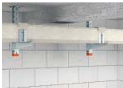
Подвесной потолочный монтаж, класс огнестойкости I