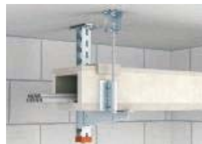
Монтаж короба с классом огнестойкости E с дополнительной фиксацией стержнем с резьбой