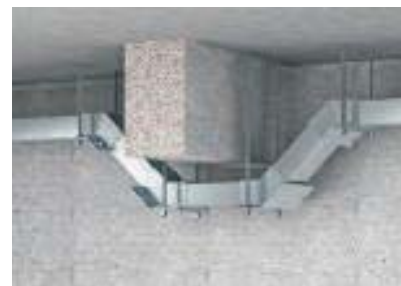
Подвешной монтаж с вертикальным изгибом