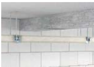
Подвесной монтаж на соединительных элементах