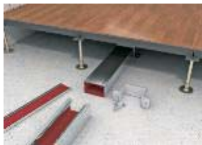
Монтаж на сыром бетоне в полу