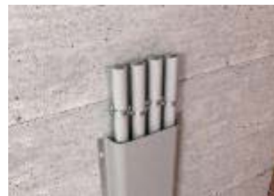
Крепление бандажа металлическими шинами при монтаже дистанционных скоб