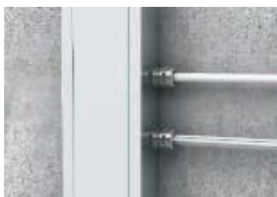
Кабельный вывод с резьбовыми соединениями V-TEC, отдельные или с универсальным уплотнительным кольцом