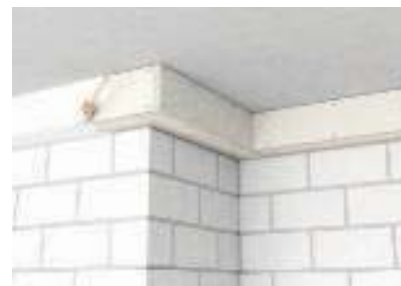
Можно красить и оклеивать обоями, для интеграции в отделку здания