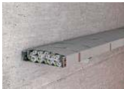
Полная обмотка кабельной трассы, настенный монтаж