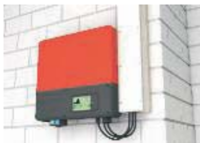
Контактная защита начинается непосредственно у преобразователя