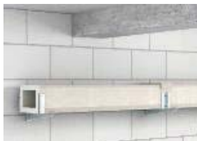
Настенный монтаж канала класса I